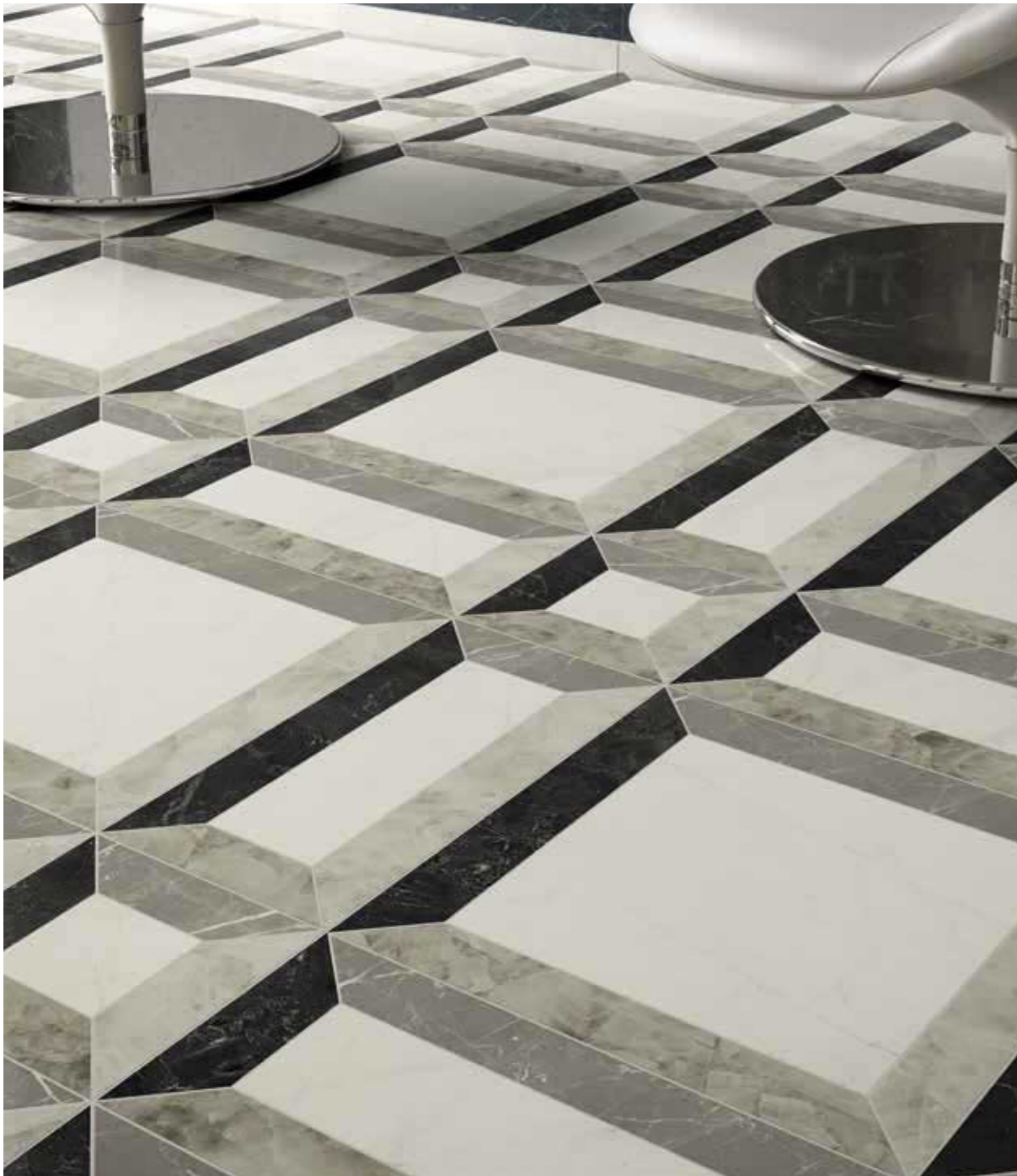
Floor Frame Nero Lux 3D 60x120