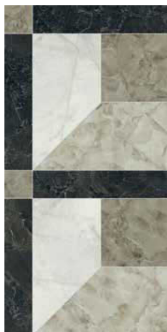
0014092 60x120 prospect nero lux 3D