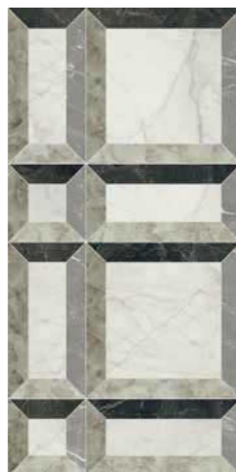
0014088 60x120 frame nero lux 3D