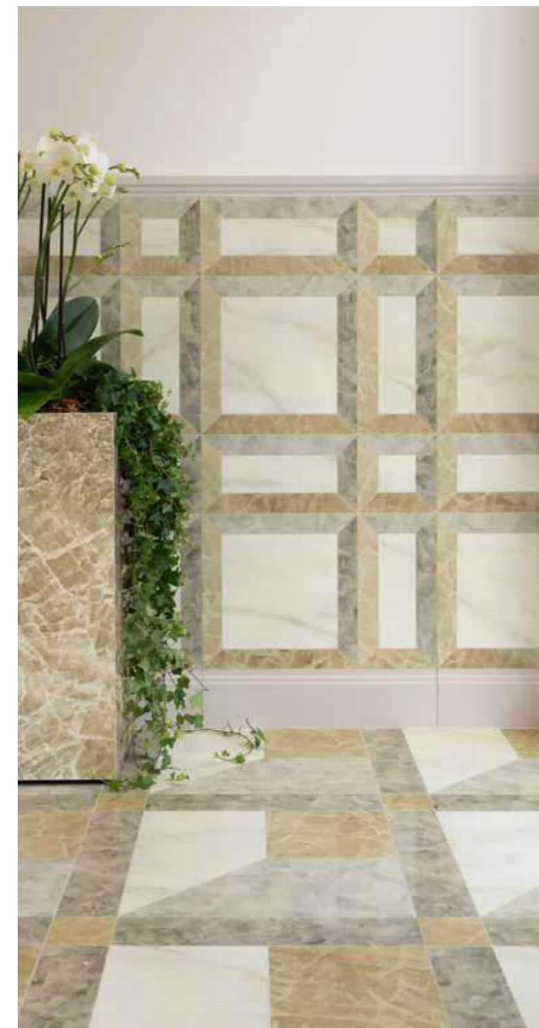
Fuga consigliata 1 mm 1 mm suggested joint