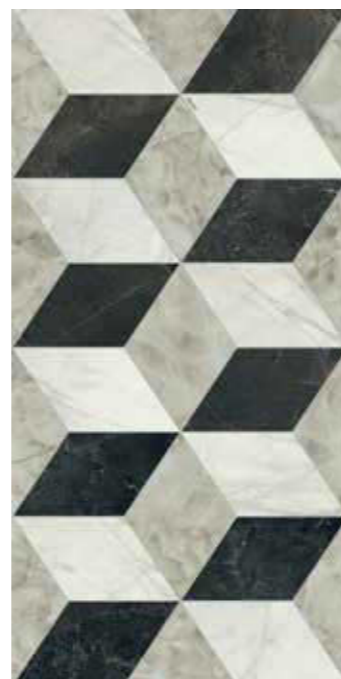
0014098 60x120 cubical nero lux 3D