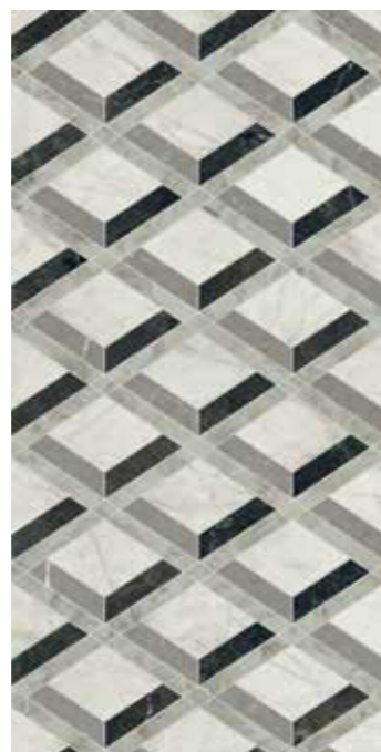
0014145 60x120 lozenge nero lux 3D