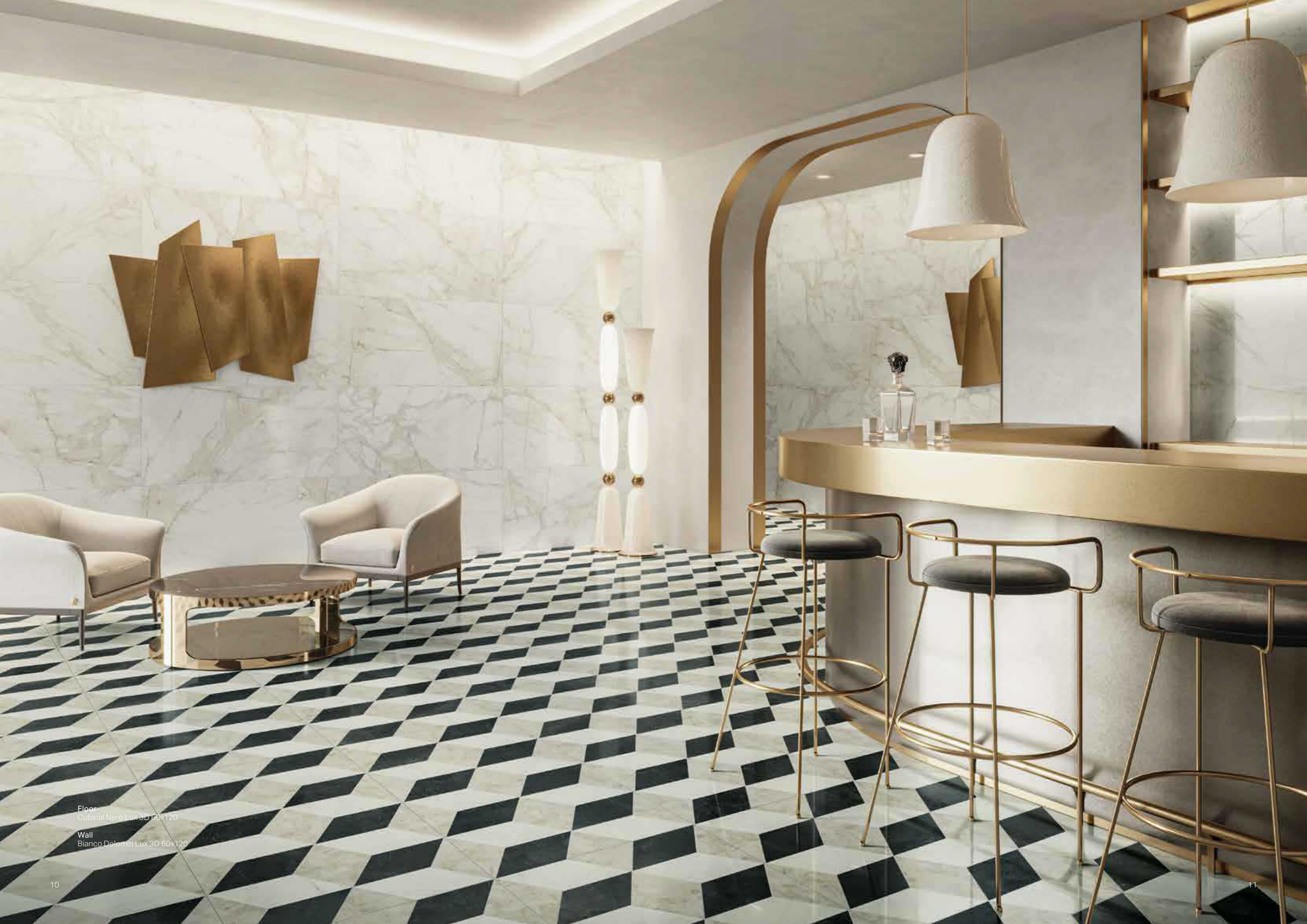
Floor Cubical Nero Lux 3D 60x120 Wall Bianco Dolomiti Lux 3D 60x120