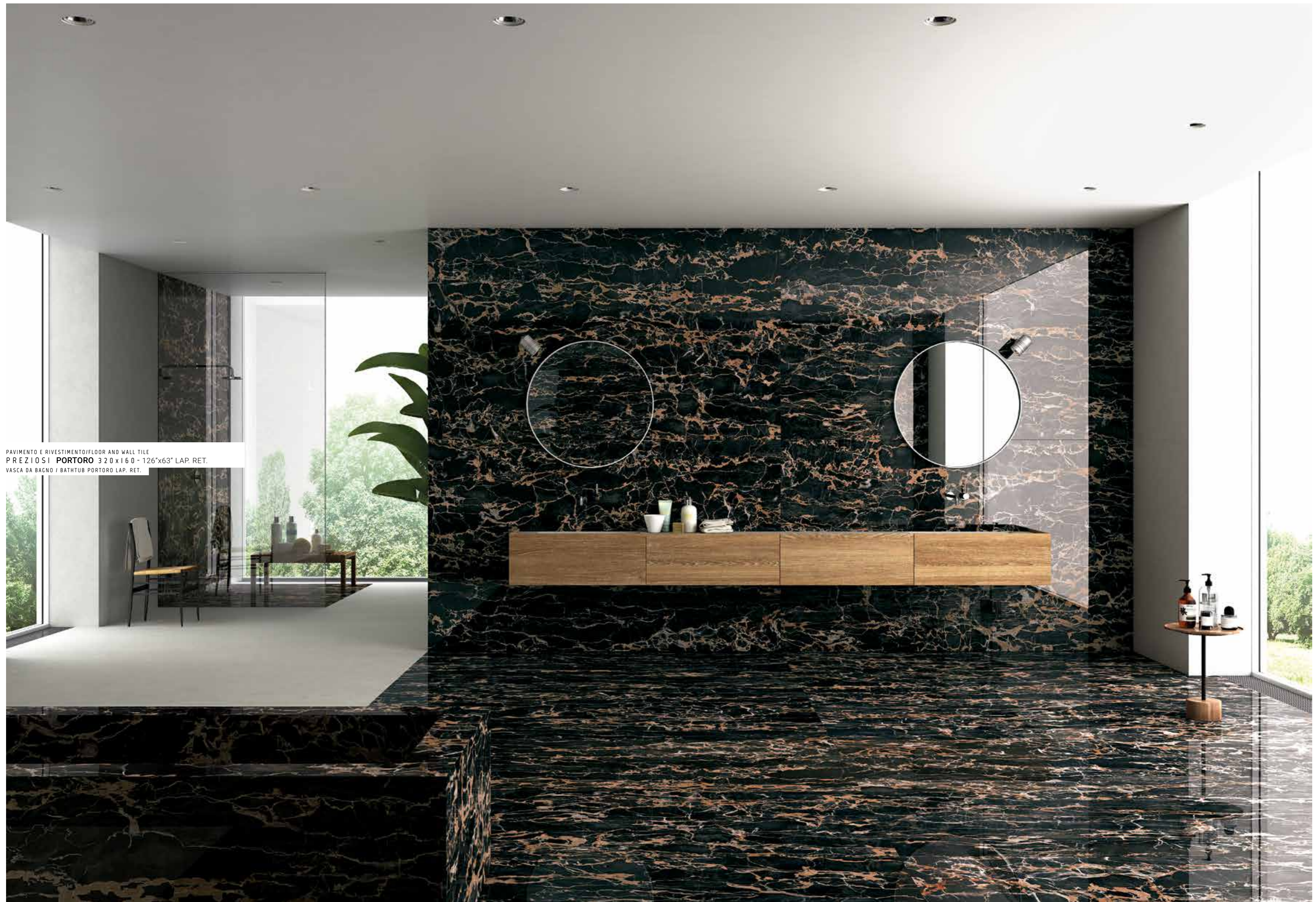
PAVIMENTO E RIVESTIMENTO/FLOOR AND WALL TILE PREZIOSI PORTORO 320 x 160 - 126"x63" LAP. RET. VASCA DA BAGNO / BATHTUB PORTORO LAP. RET.