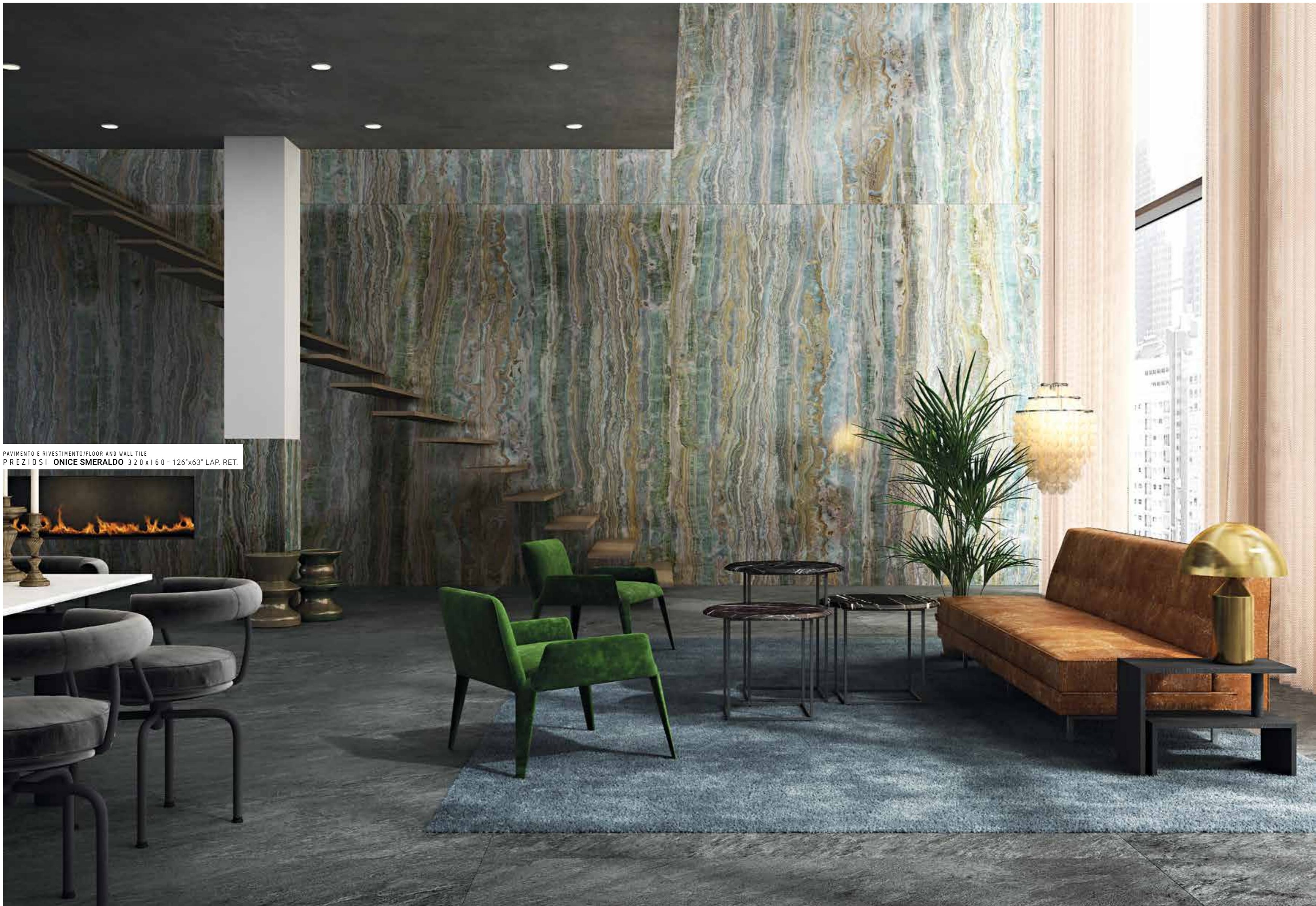
PAVIMENTO E RIVESTIMENTO/FLOOR AND WALL TILE PREZIOSI ONICE SMERALDO 320 x 160 - 126"x63" LAP. RET.